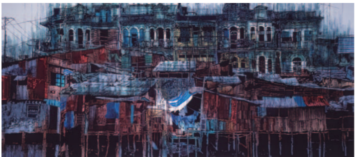
『モンズーン』 233cm × 524cm 1998年

私にとって制作は生きることと同義。でも、できれば作品は私よりもずっと長生きしてほしいと思っています。一作でも多くの作品が後世に残って、未来の誰かがその作品を見てくれたらうれしいなあって思うんです。今ももう存在しないベトナムの風景を、1000年先に作品を通じて伝えられるなんて素敵じゃないですか。