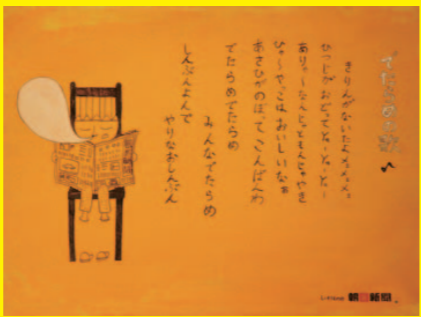
「しっかり者の朝日新聞。」新聞広告 杉江宗謙