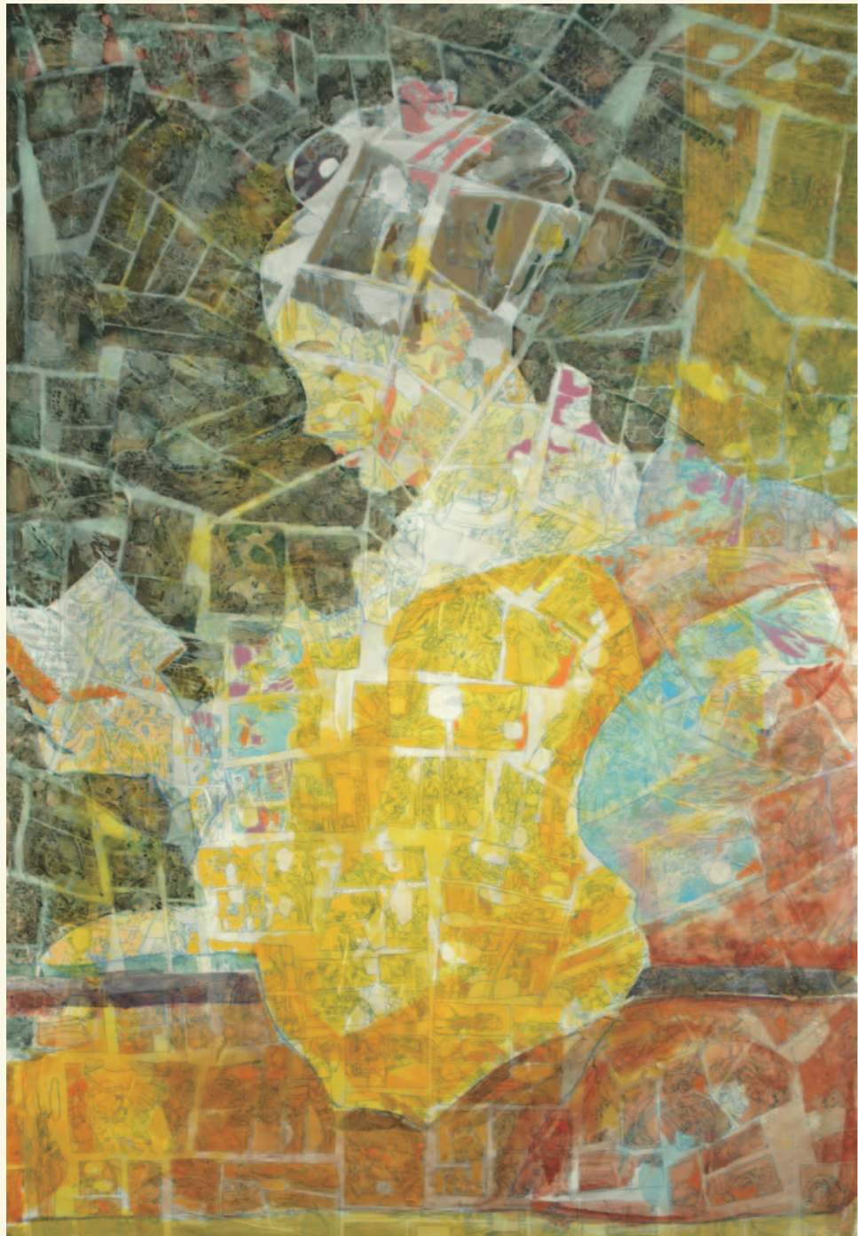
「読書をする女達」秋山佳穂（2011年度 カートゥーンコース卒業制作）