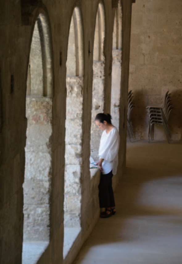
プロバンス、シルバーカース修道院にて写生 — 2012年夏

—ただ、最初の展覧会の準備はとも大変だったそうですね。何もかも前例がないなかでの準備作業は、すべて一から手作りだったんです。画材や文房具など