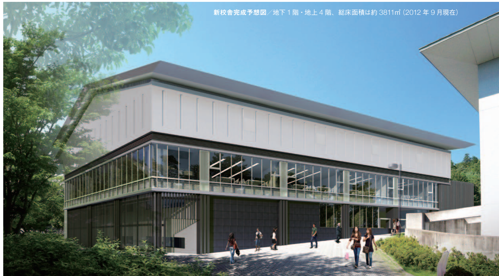
新校舎完成予想図／地下1階・地上4階、総床面積は約3811㎡(2012年9月現在)

ポピュラーカルチャー学部は、音楽コースとファッションコースからなる実技系の学部。そのため、新校舎では各々のホームルームのほか、約500人収容の多目的ホール、録音スタジオ、練習スタジオ、機材室、ファッションの工房、ギャラリーなどを設ける。また、2階の総合研究室は音楽コース、ファッションコースの教員が一堂にそろう場所となる。音楽やファッションに没頭できる制作環境が整うと同時に、両コースの教員も学生も一緒になって語り、新しいアイデアや作品を生み出す場となることが期待される。