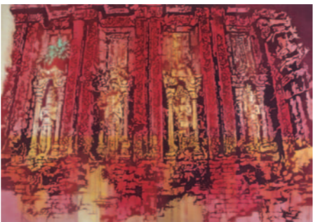
『ミーソンー熱』 232cm × 336cm 2001年