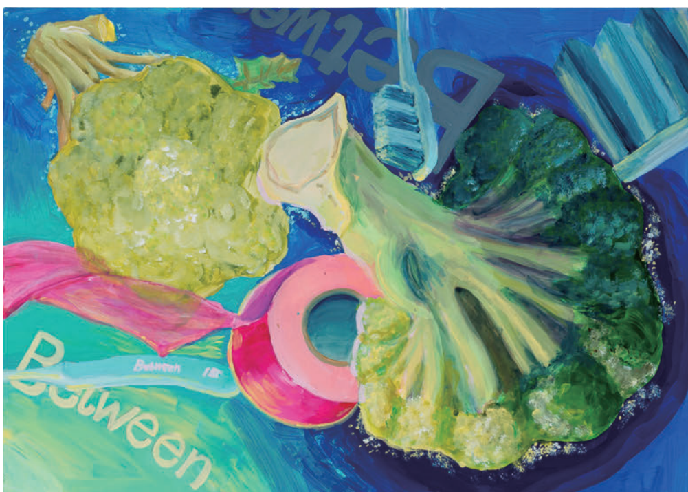
色彩表現 モチーフ②

明快な構成と、色使いがとても印象的です。モチーフのテープを使って、空間を切りながら、視線の誘導も巧みにできていて、白の空間がとてもきれいに見えます。ただ、歯ブラシの表現にもう一工夫あれば、さらに魅力的なものになったでしょう。