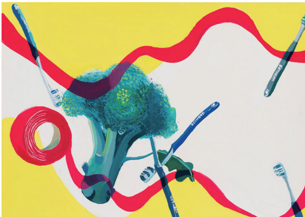
色彩表現 モチーフ②