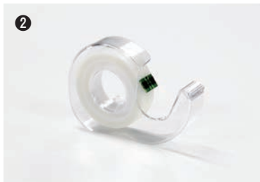
●メンディングテープ 1個